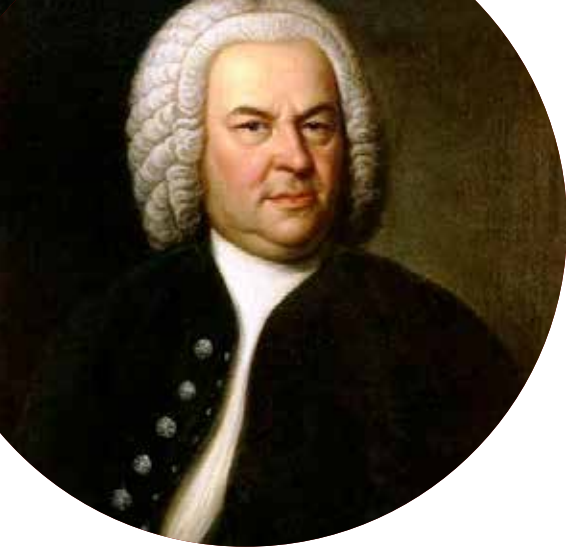
Johann Sebastian Bach im Jahre 1746, (nach dem Ölgemälde von Elias Gottlob Haußmann aus dem Jahre 1748)